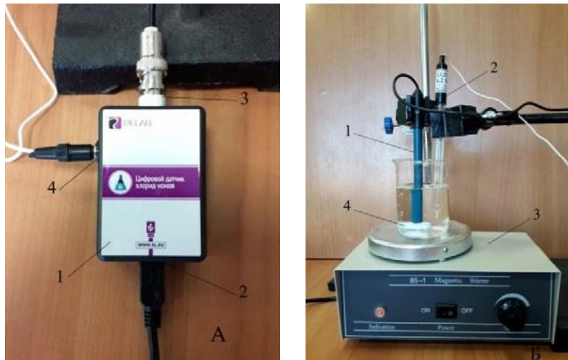
Рис. 2. Установка для определения концентрации (активности) хлорид-ионов в растворе. А: 1 — корпус датчика для определения \text{Cl}^- -ионов; 2 — разъём Micro USB для подключения к компьютеру; 3 — разъём BNC для подключения рабочего электрода; 4 — разъём для подключения электрода сравнения. Б: 1 — ионоселективный электрод (рабочий электрод); 2 — электрод сравнения (хлорсеребряный электрод); 3 — магнитная мешалка; 4 — якорь магнитной мешалки

На рисунке 2 показана общая схема использования ИСЭ для количественного определения концентрации (активности 2 ) различных ионов: \text{Cl}^- , \text{NO}_3^- , \text{NH}_4^+ , \text{Ca}^{2+} . Основным компонентом любого ИСЭ — мембрана, которая разделяет внутренний раствор с постоянной концентрацией определяемого иона и исследуемый раствор, а также служит средством электролитического контакта между ними. Мембрана обладает ионообменными свойствами, причём проницаемость её к ионам разного типа различна.