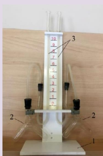
Рис. 4. Прибор для демонстрации зависимости скорости химических реакций от различных факторов: 1 — подставка; 2 — сосуды Ландольта; 3 — манометрические трубки

Прибор для демонстрации зависимости скорости химических реакций от различных факторов используют при изучении темы «Скорость химической реакции» и теплового эффекта химических реакций. Прибор даёт возможность экспериментально исследовать влияние на скорость химических реакций следующих факторов: природы реагирующих веществ, концентрации реагирующих веществ, площади границы раздела фаз в гетерогенных системах (поверхности соприкосновения между реагирующими веществами), температуры, катализатора, ингибитора.