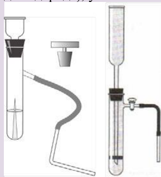
Рис. 7. Прибор для получения и собиария газов

Прибор для получения газов используется для получения небольших количеств газов: водорода, кислорода (из пероксида водорода), углекислого газа .