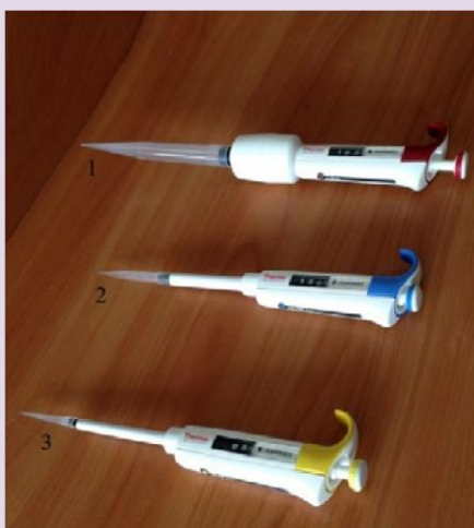
Рис. 5. Пипетки дозаторы одноканальные переменного объёма: 1 — 110 мкл; 2 — 100—1000 мкл; 3 — 10—100 мкл

Пипетка-дозатор — приспособление, используемое в лаборатории для отмеривания определённого объёма жидкости. Пипетки выпускаются переменного и постоянного объёма. В комплекты оборудования для медицинских классов входят удобные пипетки-дозаторы одноканальные, позволяющие настроить необходимый объём отбираемой жидкости в трёх различных диапазонах (рис. 6). Использование современных технологий и цветовой кодировки диапазона дозирования даёт возможность качественно, точно, безопасно выполнять пипетирование. Пипетки имеют сменные пластиковые наконечники.